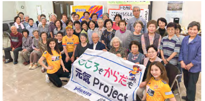
6月4日(火) 仙台市 将監南集会所