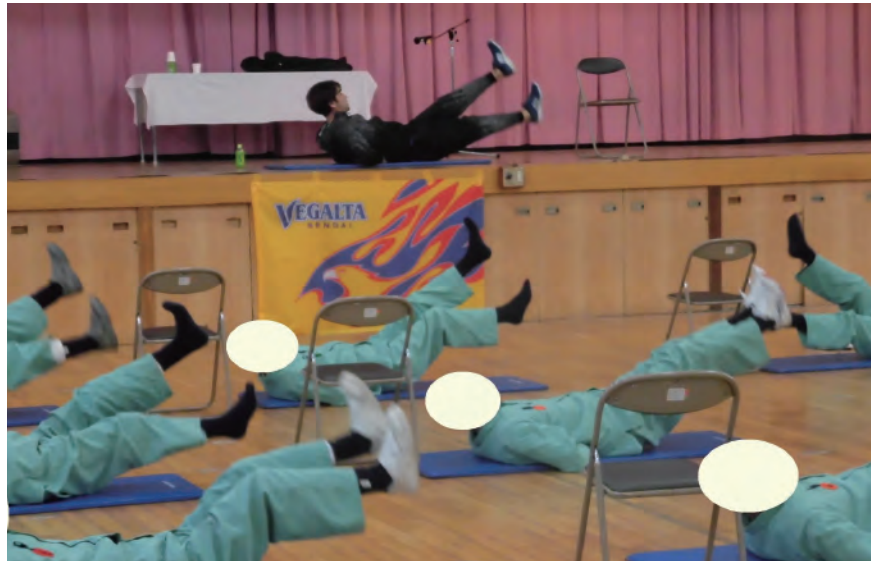
1月18日(金) 宮城刑務所健康体操教室