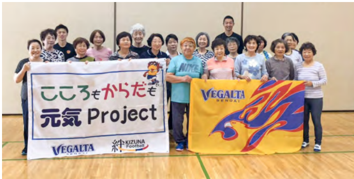
5月23日(木) 仙台市 東四郎丸コミュニティセンター