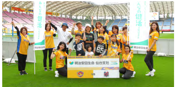
6月30日(日) 札幌戦 明治安田生命健康体操教室