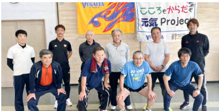
12月10日(火) 気仙沼市 市民健康管理センター