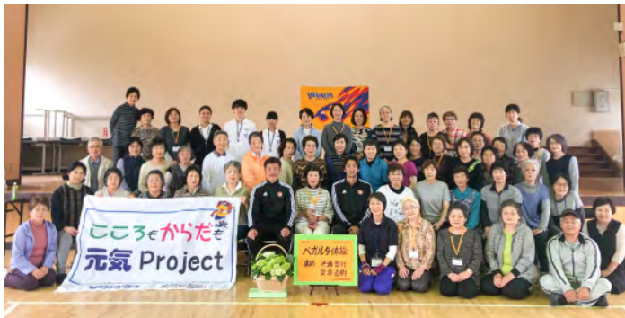
6月11日(火) 石巻市 山下屋内運動場