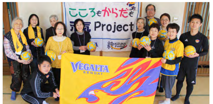
11月6日(水) 仙台市 中山市民センター